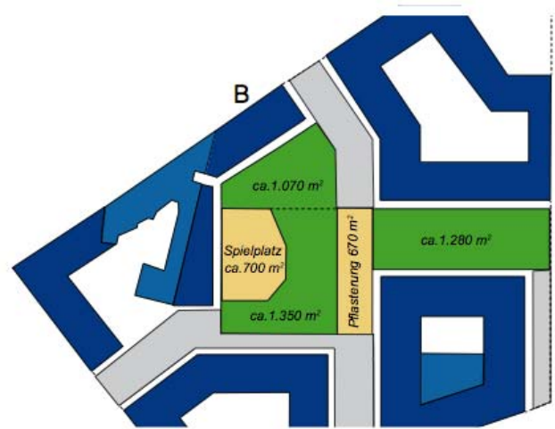
Änderungsvariante Block B

Die Piratenfraktion Friedrichshain-Kreuzberg entlässt diesen Antragstext in die Gemeinfreiheit (Public Domain) als CC-0 ( http://creativecommons.org/publicdomain/zero/1.0/legalcode ). Sie verzichtet weltweit auf alle urheberrechtlichen und verwandten Schutzrechte, soweit dies gesetzlich möglich ist. Der Antragstext darf ohne weitere Erlaubnis kopiert, verändert, verbreitet und aufgeführt werden. Dies schliesst kommerzielle Zwecke explizit mit ein.